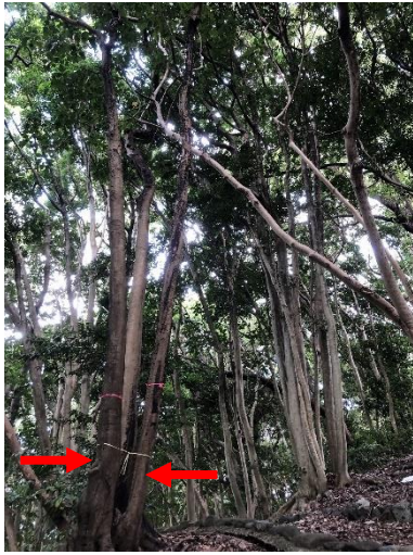
④テニスコート南散策路A