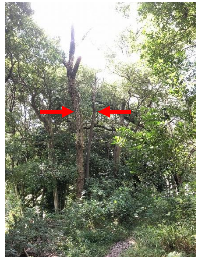
⑨⑩喜春橋南東の散策路