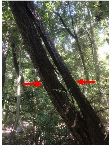
⑤テニスコート南散策路B