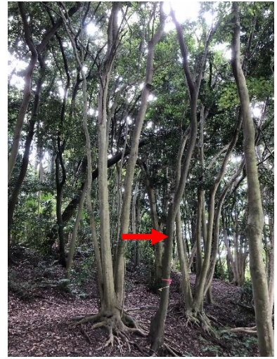
⑥テニスコート南散策路C