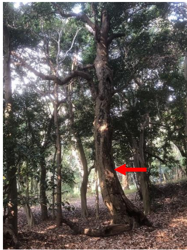
⑫図書館南西の散策路