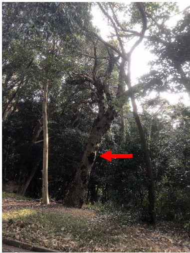
⑪図書館南西の園路